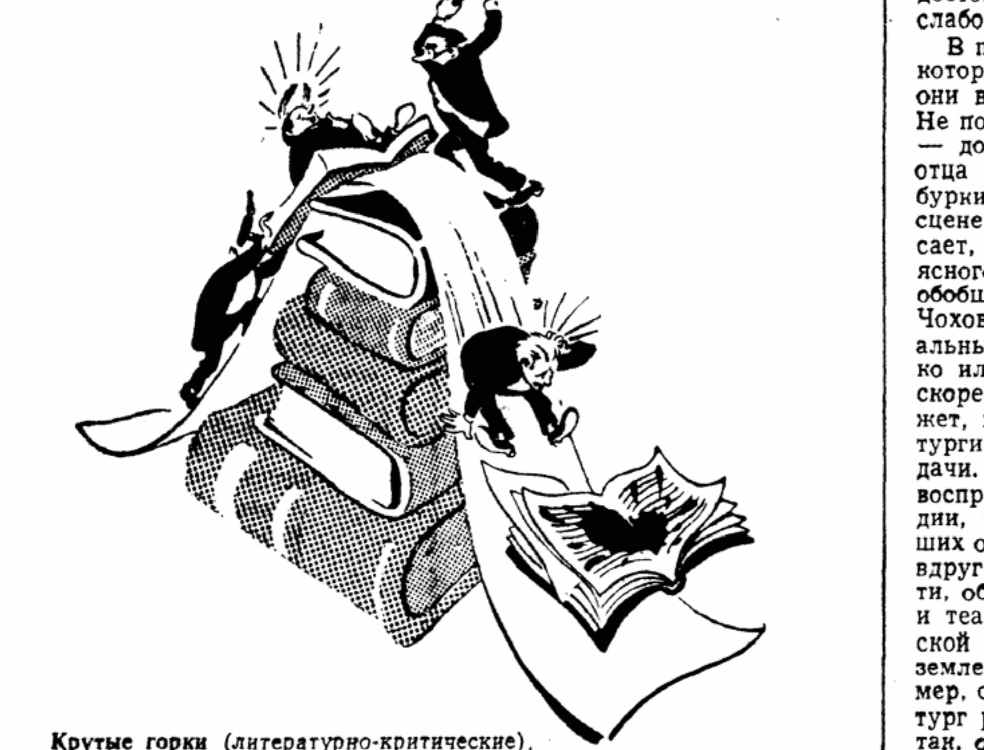
Крутые горы (литературно-критические). Рис. И. Фридмана

Если ИМЕТЬ в виду поэтов, пишущих на русском языке, то можно смело сказать, что лучшие поэтические силы страны собраны в Воронеже в таких крупных городах, как Москва и Ленинград.