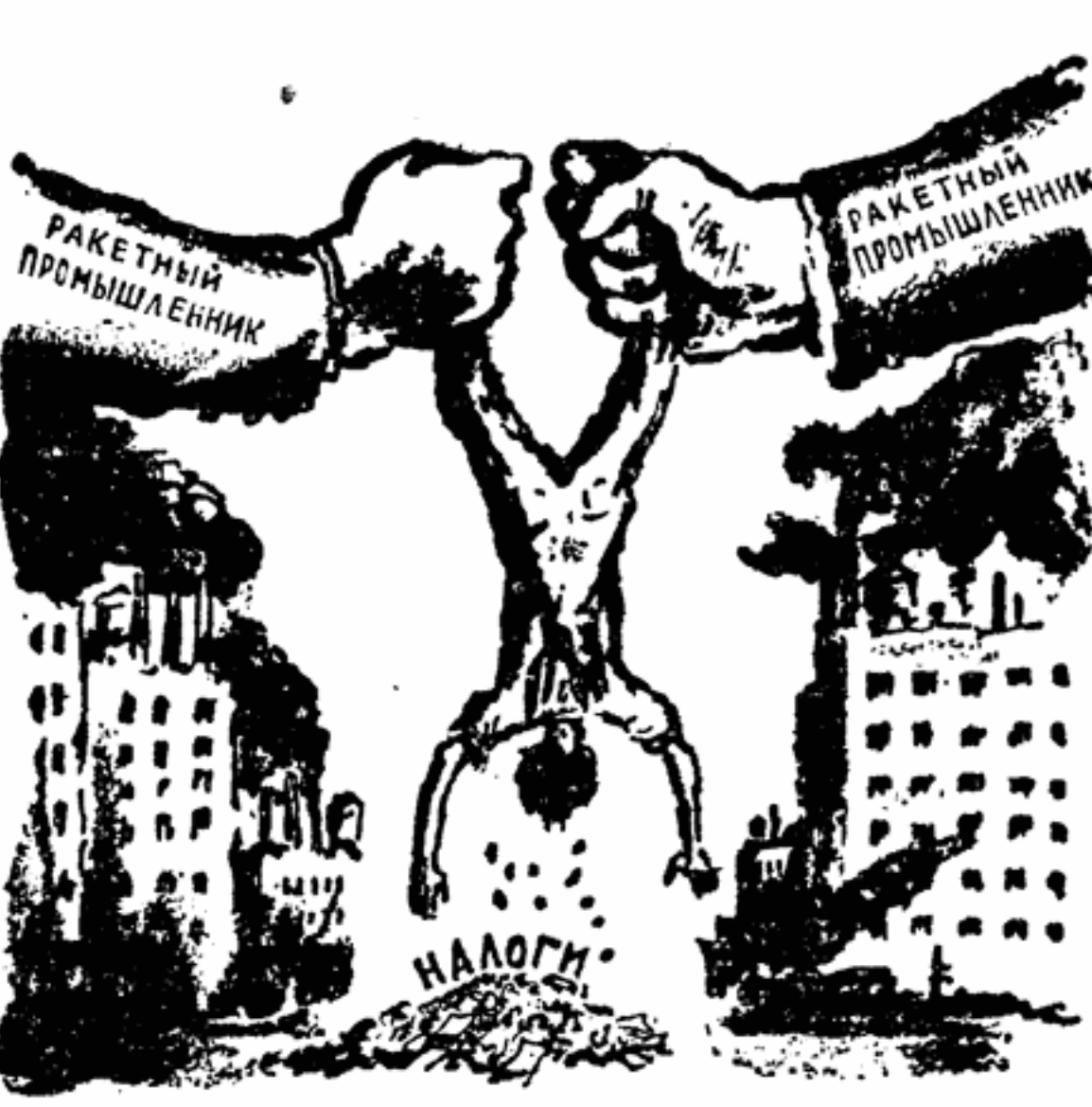
Рисунок из американской газеты «Уорриер»

Вот заказ на ракетный снаряд среднего радиуса действия — «Опигер» — авиационным компаниям получить не удалось. Новый министр обороны Макларой поспешил передать его своей корпорации Крайслер, несмотря на то, что испытания снаряда провалились.